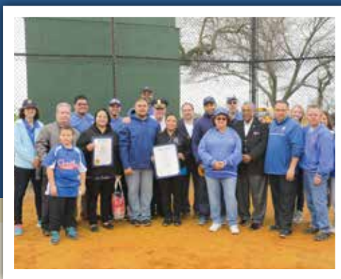
Bridgeport Caribe Youth Leaders Opening Day