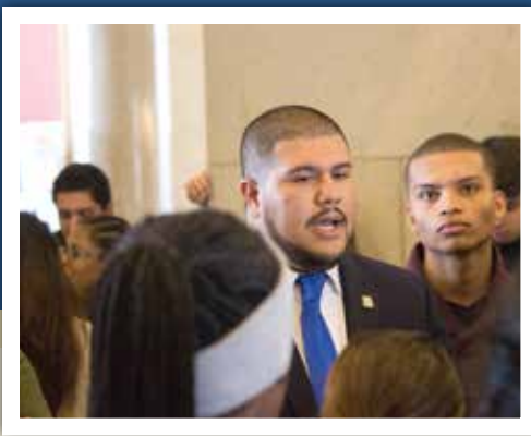
Bridgeport Day at the Capitol