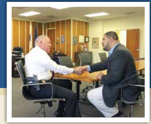
Housing Security Tour